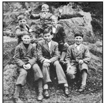
Výlet - Kokory