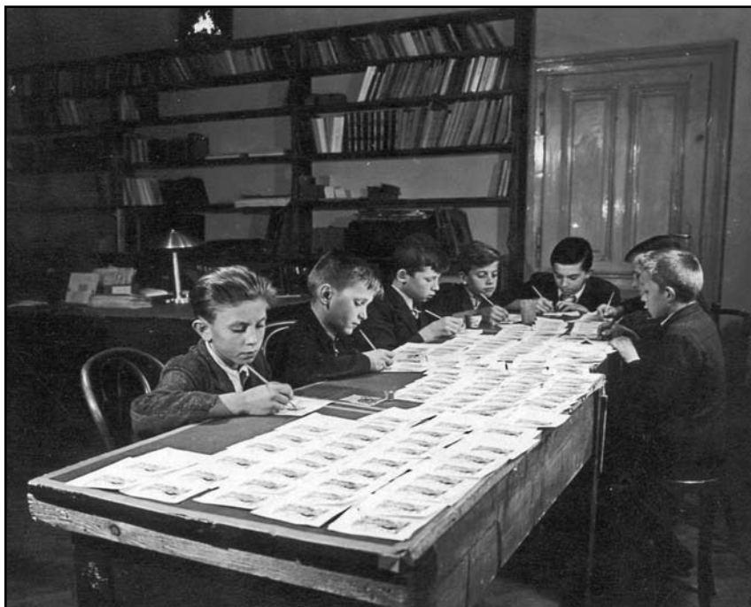
Kolorování obrázků v roce 1946

Letáček ze srpna 1945 výmluvně ukazuje materiální a finanční situaci Scholy, která ji provázela téměř po celou dobu její činnosti: „Vážení a milí přátelé, obracím se zcela soukromě k několika největším příznivcům břevnovské školy Scholy cantorum s prosbou, zda by svůj laskavý budoucí příspěvek mohli sboru věnovat RADĚJI TED, kdy je k dobrému počátku potřeba mnoha peněz NAJEDNOU. – V Praze v srpnu L. P. 1945, Správce Scholy cantorum.