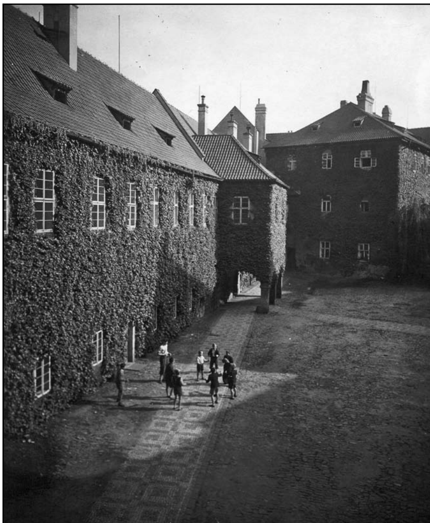
Na strahovském nádvoří 1948-50

zvládnutí partu i malými zpěváčky všeobecně překvapily. Benediktinské opatství břevnovské, vydržující Scholu cantorum, koná velmi záslužnou službu uměleckou, nýbrž i sociální. Pozoruhodný byl vytištěný program, jenž za malou cenu posky-