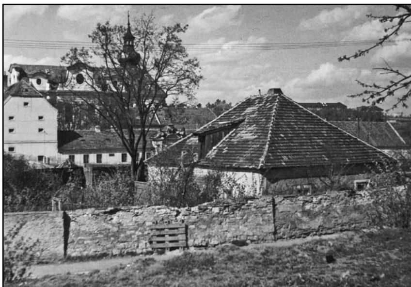
Domeček - Brevnov 1946

Vedle koncertní činnosti, omezené na Prahu, podnikala Schola cantorum četné zájezdy po celých Čechách a Moravě: