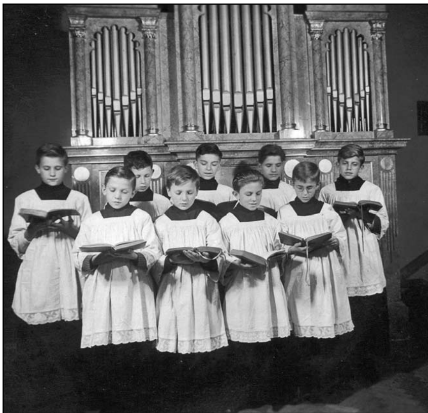
Schola cantorum v roce 1946

Československý hudební slovník osob a institucí (1962), nejvýznamnější domácí poválečný slovník, heslo „schola cantorum“ vůbec neobsahuje. O její existenci informuje pouze v rámci hesla „Venhoda, Miroslav“: „[...] Založil v Břevnově chlapecký sbor Schola cantorum (1939), jež rozšířil později na smíšený. Uspořádal