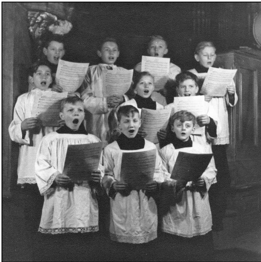
Strahov - na kůru

Myslím, že téměř sedmdesát let staré hodnocení i přání Nedělních listů citované v úvodu je platné dodnes.