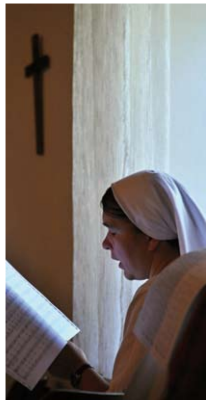
Sestra Jacka OP

V šestnácti začal aktivně spirituály zpívat a založil společně s kamarády kvartet. Po škole začal pracovat a po třech letech odjel za vydělané peníze a s finanční pomocí své obce studovat hudbu na Jamajku, na Trinidad a poté na pět let do Spojených států. Tam ukon-